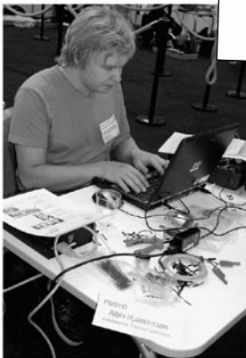
...ska programmera in de önskade funktionerna.

fyller flaskor med tre olika vätskelösningar enligt tre olika recept. Fast tankar med lösningarna fanns inte på riktigt, anslutningarna simulerades.