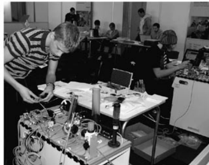
I tävlingsgrenen mekatronik byggde de tävlande upp en mindre anläggning.