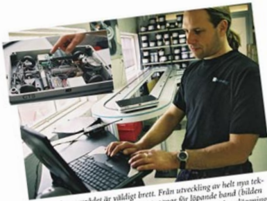
Automationsområdet är väldigt brett. Från utveckling av helt nya tekniker, till exempel trådlösa transportvagnar för löpande band (bilden ovan) till avancerad instrumentering på stora fabriker och anläggningar, till exempel ett raffinaderi på Västkusten (bilden nedan).